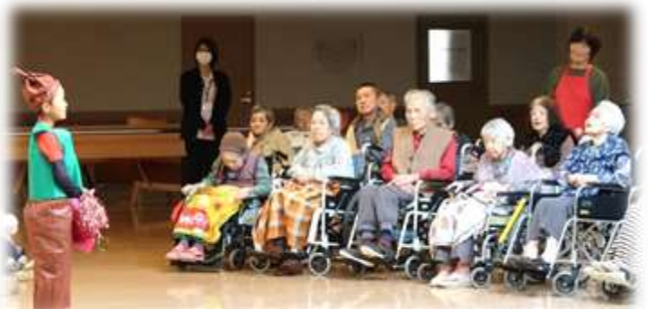
*小学校との 交流会