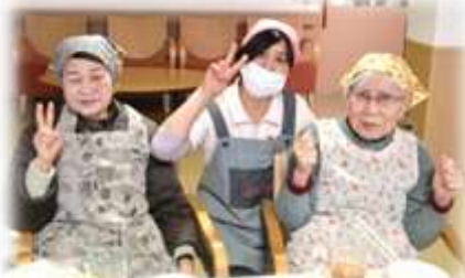
*獅子舞と共に 福来たる!