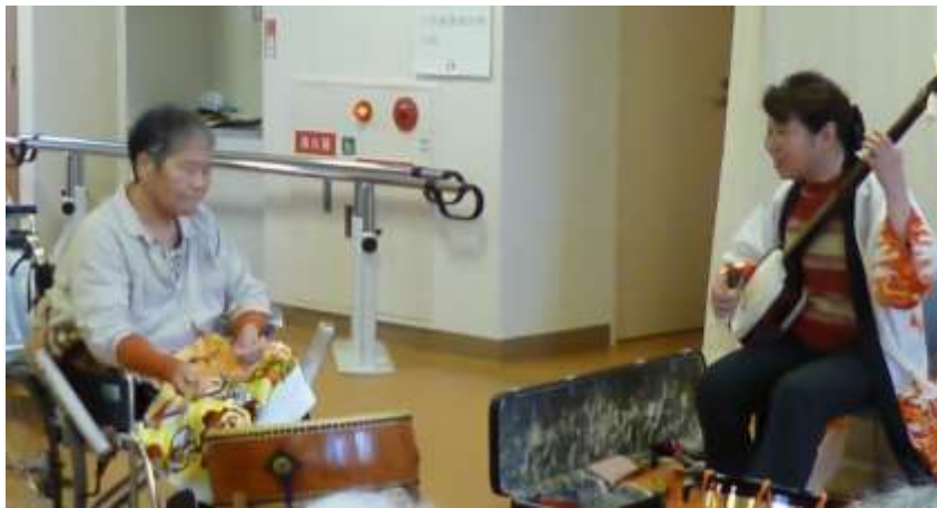
『ミュージシャン』三味線のリズムに合わせて太鼓を打ちます。 6月22日 三味線コンサート あやめ苑にて