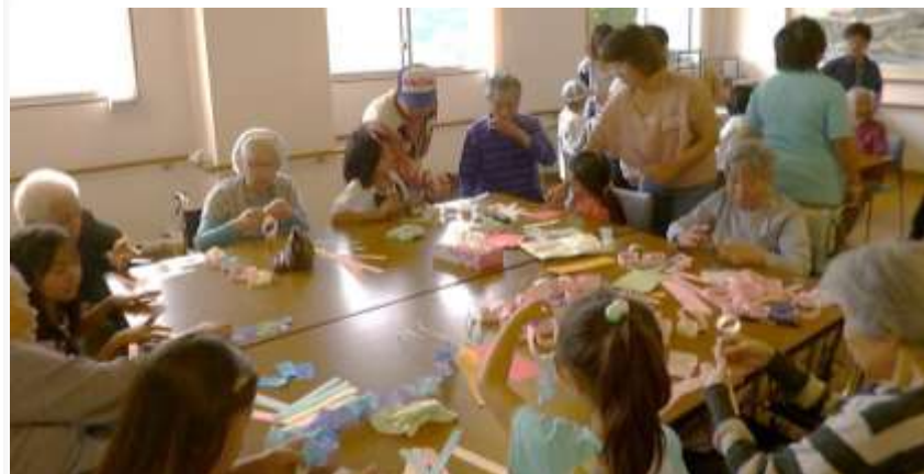
「賑やか！」七夕飾りを西十四区子供の皆さんと。 6月14日 あやめ苑にて