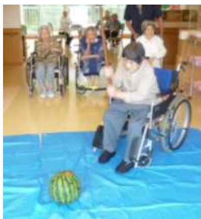
「まかせてね、狙いを定めて」 杏ユニット 7月20日

看護師になり二十五年、同じ病院で勤務してきました。毎日業務に追われ患者さんとは挨拶をするのが精一杯でした。この度、あやめ苑に勤務することになり看護長始め優しいスタッフに囲まれ楽しく過ごしています。入居者様やスタッフの皆さんの名前を早く覚え自分の名前も覚えて貰えるように、一人一人との対話を心掛けていきたいと思えます。