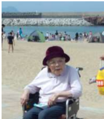
「夏のバカンス」若松区脇田海水浴場 紅葉ユニット 7月20日