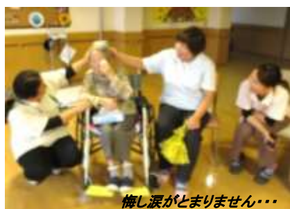
悔し涙がとまりません...