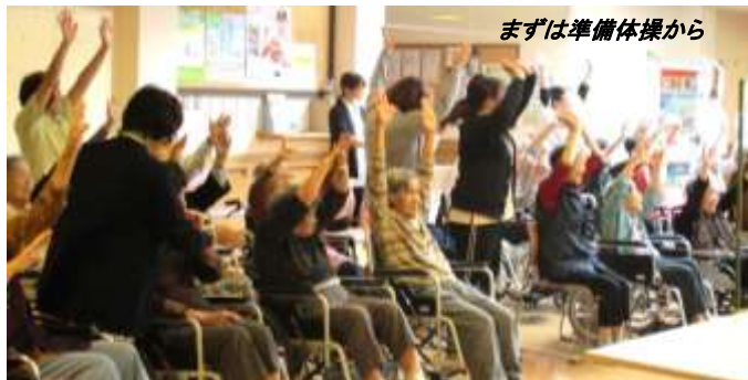
まずは準備体操から