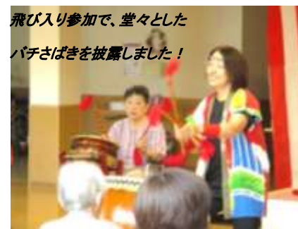
飛び入り参加で、堂々としたパチさばきを披露しました！