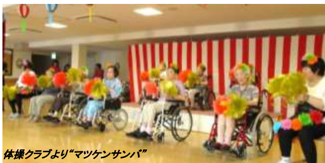
体操クラブより“マツケンサンバ”