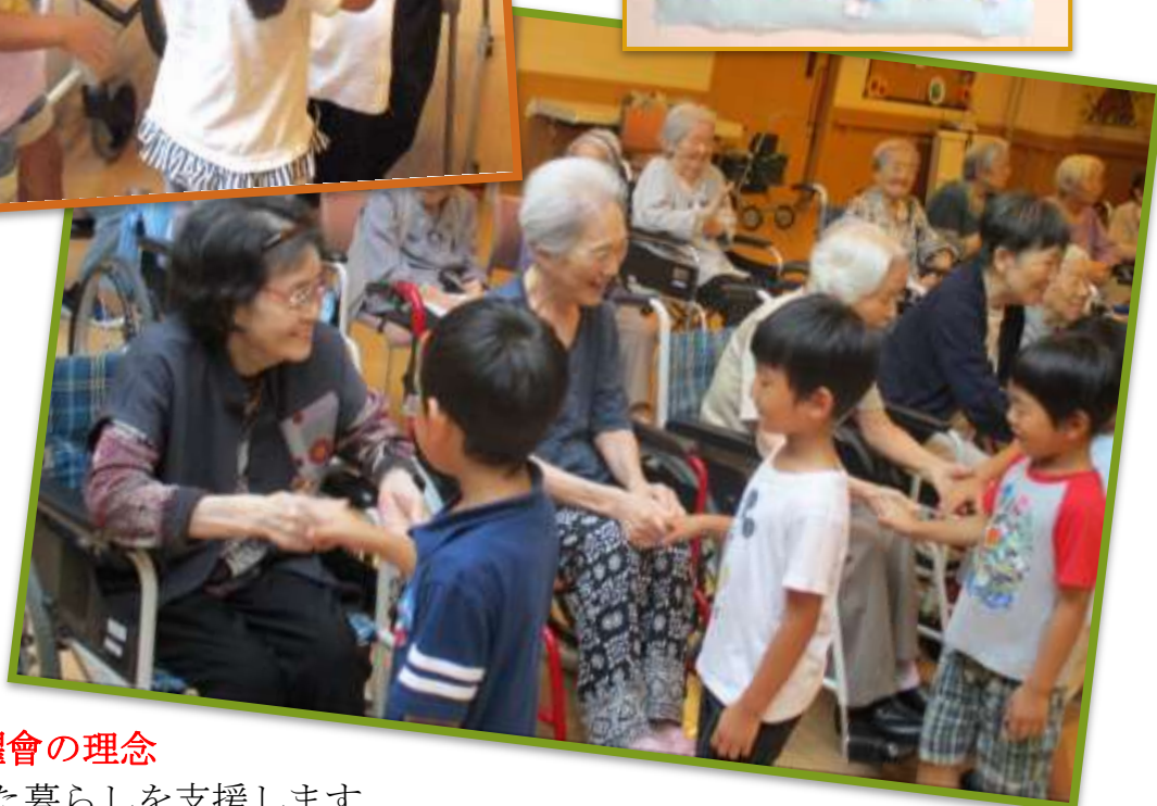
花乃路保育園 園児との交流会