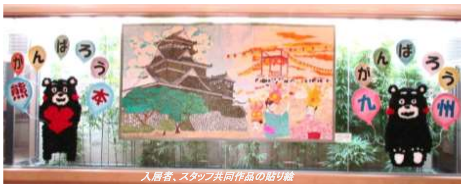
入居者、スタッフ共同作品の貼り絵