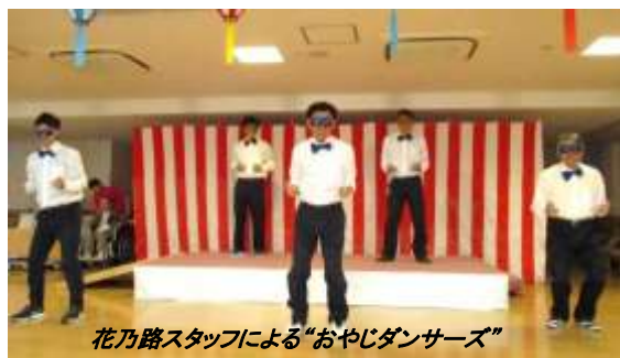
花乃路スタッフによる“おやじダンサーズ”