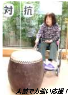
太鼓で力強い応援!