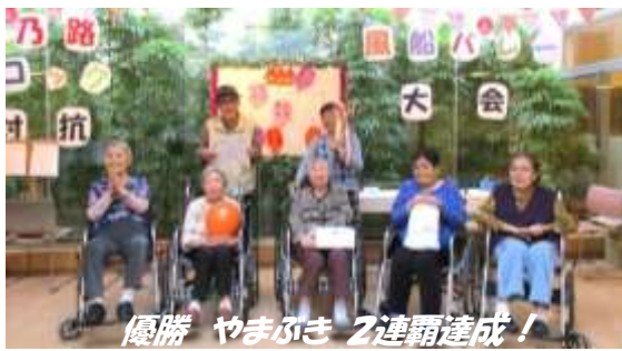
優勝 やまぶき 2連覇達成!