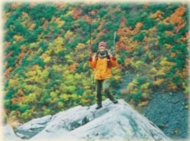
長野県 洞沢の紅葉

「屋久島に行こう」と誘われ買った登山道具がもったいなくて登り始めた山。皿倉山や富士山と高さは色々ですが、登った時の景色や達成感が気持ち良くて続いています。これから紅葉の季節、登山には、もってこいの季節です。さて、今度は、どの山に登ろうかな。