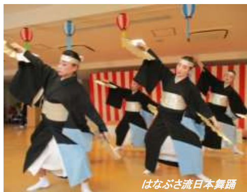
はなぶさ流日本舞踊