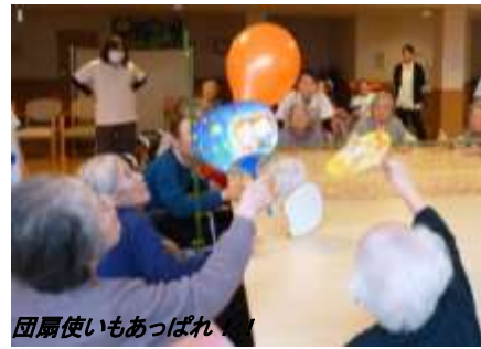
団扇使いもあっぱれ!