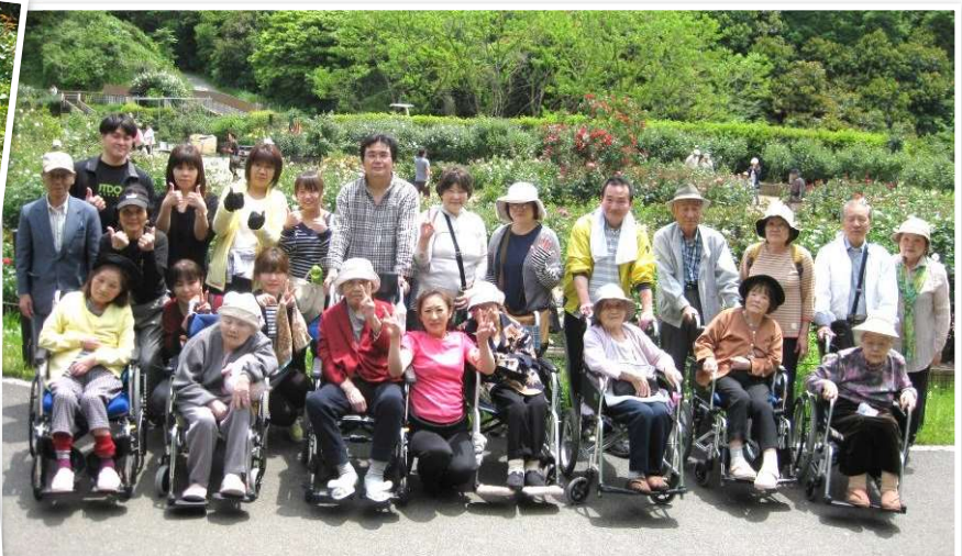
Dブロック 5月 ご家族様と一緒にグリーンパークへ