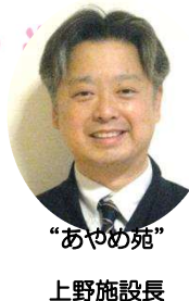
“あやめ苑” 上野施設長

花乃路は、3月に8年目を迎え上野副施設長が、“あやめ苑”施設長として異動となりました。 4月には新社会人となったスタッフが4名入職、スタッフのユニット異動もあり新体制となりました