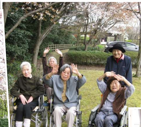
Eブロック 4月 お花見へ