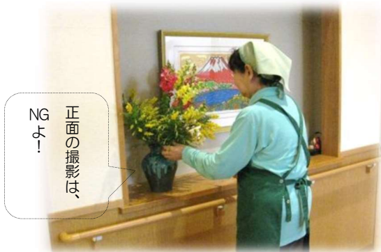
正面の撮影は、 NGです！