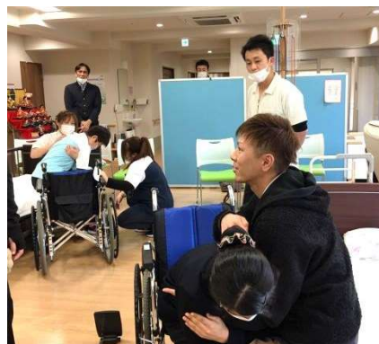
介護者が座ったままで、相手を腿に乗せてスライドするやり方