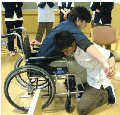
足にあまり力のない人の場合、背負い込むことで、また、前かがみができない人には胸を合わせるトランスを実施