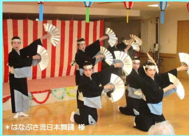
*はなぶさ流日本舞踊様