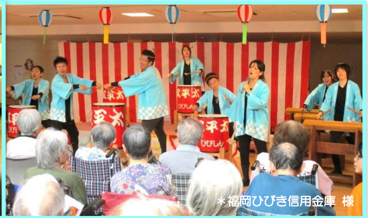
*福岡ひびき信用金庫様