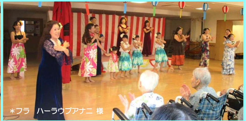
*フラ ハーラウプアナニ様