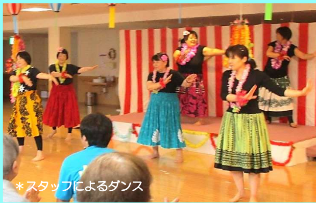
*スタッフによるダンス