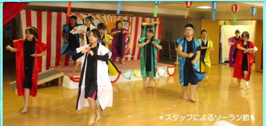
*スタッフによるソーラン節