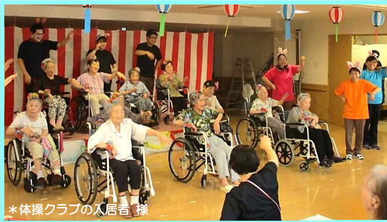
*体操クラブの入居者様