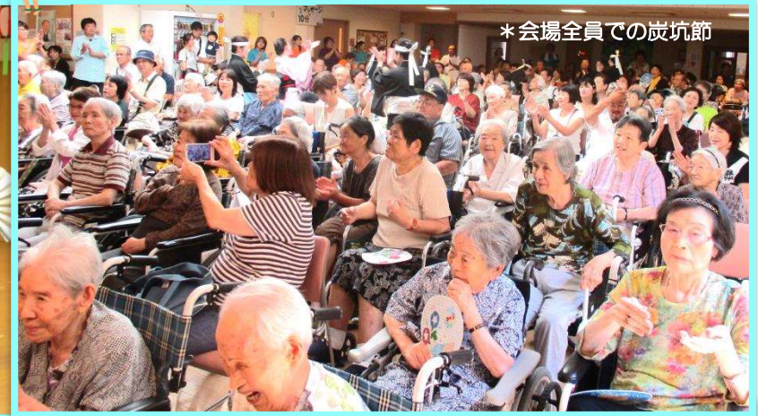
*会場全員での炭坑節